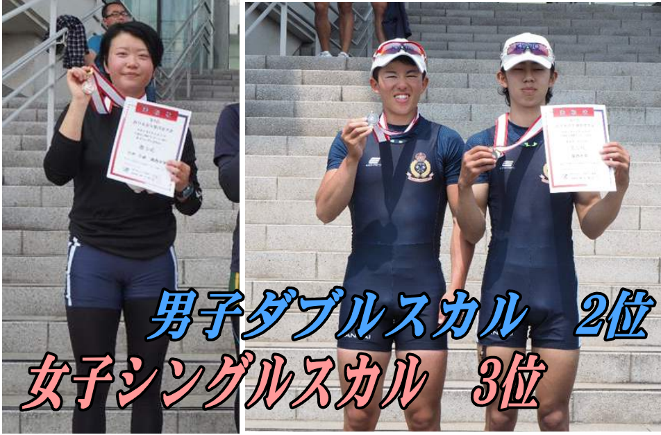
男子ダブルスカル 2位 女子シングルスカル 3位

予選では僕らの強みであるスタートスパートで前半のkmで先頭に出ることができたものの、ラストスパートで差されるという苦しい結果になった。決勝ではスタート位置で進路方向の調整をミスしてしまいスタートスパートで出られず、結局追いつけないまま二位でゴール。 今回の西日本選手権はテクニク的なことよりポート競技の作法や基本的なことの重要性を改めて再認識した大会であった。