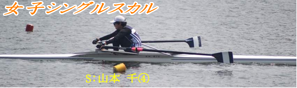
女子シングルスカル