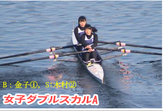
女子ダブルスカルA