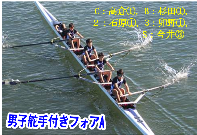
男子舵手付きフォアA