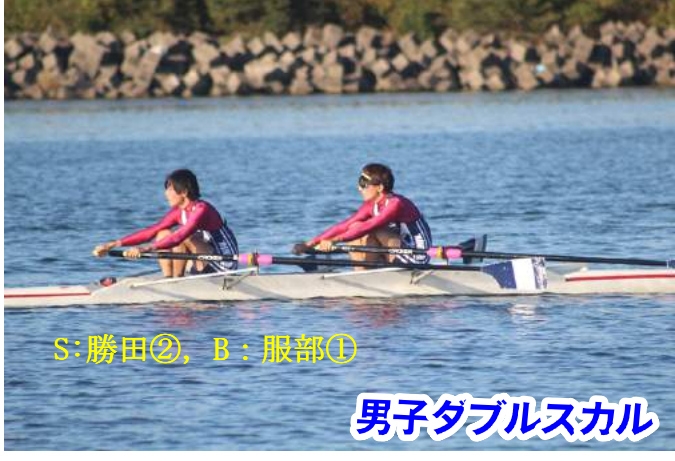
男子ダブルスカル